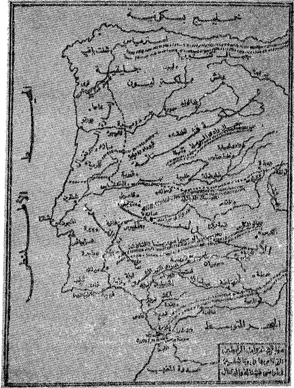
مواقع غزوات المراكبيين التي قام بها علي وتاشفين في اراضي قشتالة والبرتغال